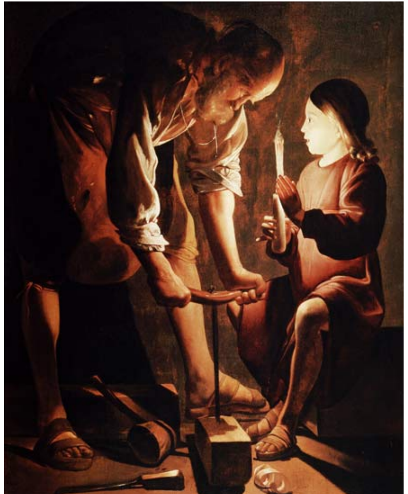
Georges De La Tour: San Giuseppe 1642 Museo del Louvre, Parigi (fig. B)

L'attenzione di San Giuseppe, rivolta all'azione che sta svolgendo, è sottolineata dalla posizione del suo corpo, dalla testa e dallo sguardo rivolti al legno da forare; tutt'intorno, dalla penombra, emergono gli arnesi da falegname ed i trucioli disseminati sul pavimento. Attraverso l'uso del "lume" l'artista descrive oggetti e sentimenti; proprio osservando il meravigliato ed ammirato sguardo di Gesù rivolto al lavoro dell'esperto genitore, suo maestro, si comprende quanto forte sia il legame affettivo che li unisce; l'impatto emotivo che coinvolge il fruitore è immediato e permane a lungo nella memoria.