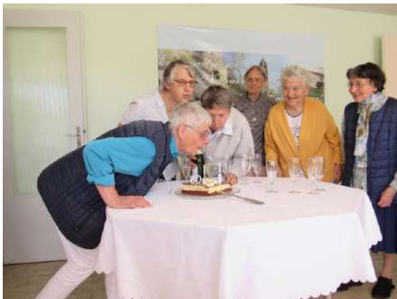
aniversárias de 80 anos