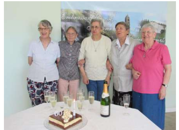
vida religiosa de 60 anos